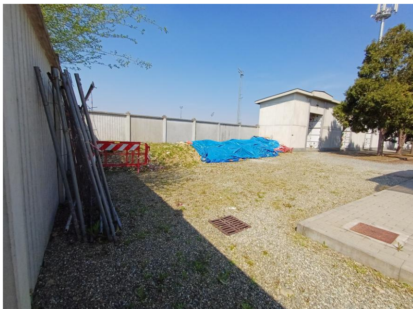
Foto stato dei luoghi

Lo scopo dell'intervento è quello di realizzare loculi e cellette oltre a creare, se è possibile, un'area dedicata alla dispersione delle ceneri "Giardino delle rimembranze" secondo le disposizioni di legge vigenti in materia.