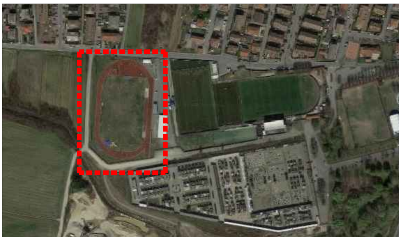
INQUADRAMENTO CAMPO IN ERBA NATURALE

A termine di Legge ci riserviamo la proprietà di questo disegno con il divieto di riprodurlo o comunque renderlo noto a terzi senza la preventiva autorizzazione, salvo quanto previsto dalla L.241/90 e s.m.i. art. 22-23-24-25