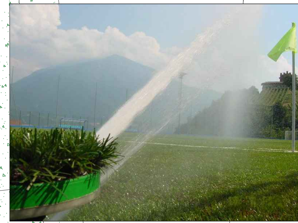
IMMAGINE TIPO IRRIGATORE