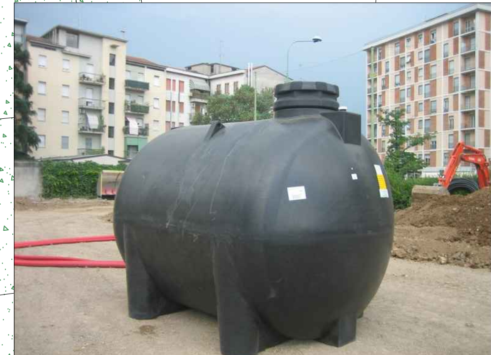
FOTO ESEMPIO VASCA DI ACCUMULO