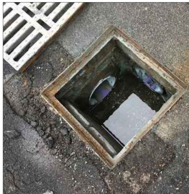
POZZETTO DI ISPEZIONE